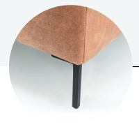
Standaard metalen hoekpoot