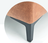
Metalen hoekpoot (chrom, zwart)